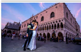
ウェディングフォト Yervantが解説

Yervantは、伝統を重んじるウェディングフォトの世界で独自の撮影アプローチを展開しており、世界中の写真ワークショップでも講師として豊富な経験を誇ります。このシリーズでは、Yervantが停滞する現状の撮影術に挑戦し、新しいアングルを見つけ出します。そこで、イタリアのヴェネチアを舞台に街角、路地、酒場など、今までにない場所に被写体を立たせました。